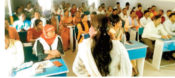
प्रशिक्षण में शामिल शिक्षक।