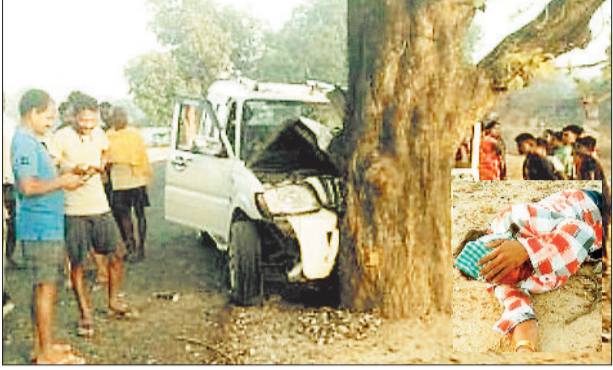
पेड़ से टकराई स्कार्पियो। इनसेट में घायल व्यक्ति।

जानकारी के अनुसार स्कार्पियो बाराती गाड़ी है। जो सूरजपुर भुरानीडांड से शादी समारोह से दुलदुला के कोरना बिपैतपुर वापस लौट रही थी। प्रत्यक्षदर्शियों के मुताबिक घटना सुबह 5 बजे की बताई जा रही है, देखने वाले लोगों का कहना है कि साहीडांड के पास तेज रफ्तार से गुजर रही स्कार्पियो क्रमांक सीजी 10 एनए 8852 अनियंत्रित होकर महुआ के पेड़ से जा टकराई, घटना का बाद स्कार्पियो में 5 पुरुष व 1 महिला